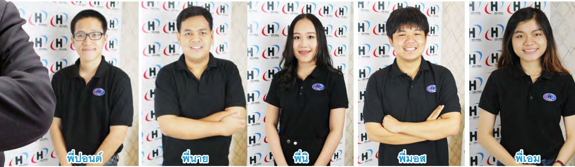
พี่ปอนด์